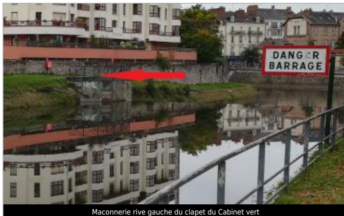
Maconnerie rive gauche du clapet du Cabinet vert