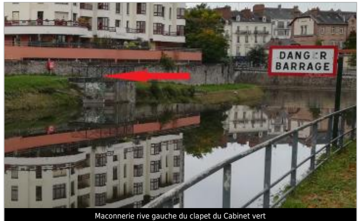
Maconnerie rive gauche du clapet du Cabinet vert

Coordonnées WGS84 : X: -1.66447728 / Y: 48.10795060