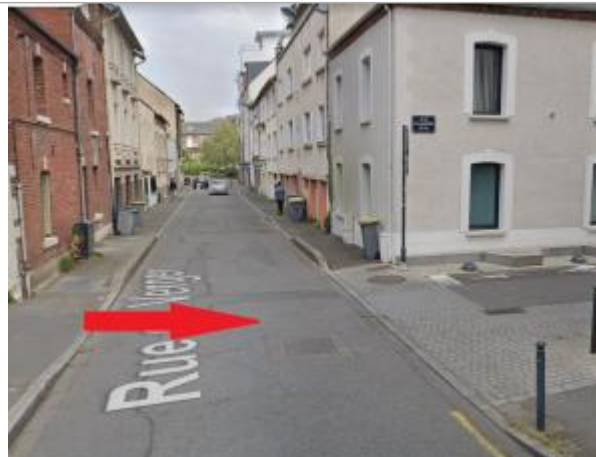
Intersection des rues du Verger et du docteur Nouaille

Coordonnées WGS84 : X: -1.66709853 / Y: 48.10646450