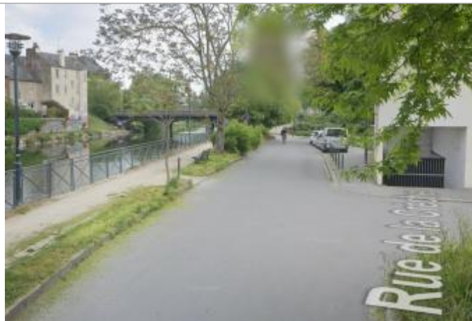
Chaussée devant le 22 rue du Verger

Coordonnées WGS84 : X: -1.66746206 / Y: 48.10728690