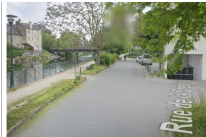
Chaussée devant le 22 rue du Verger