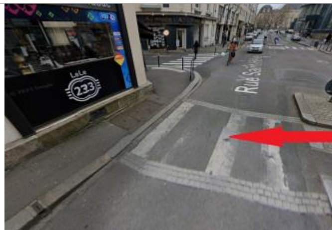
Devant le 23 rue Saint-Hélier

Coordonnées WGS84 : X: -1.67191926 / Y: 48.10735900