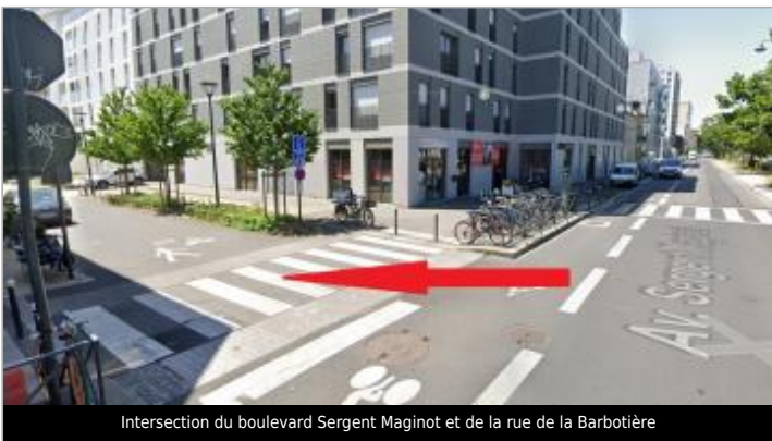
Intersection du boulevard Sergent Maginot et de la rue de la Barbotière

GÉOLOCALISATION Coordonnées WGS84 : X: -1.66677368 / Y: 48.10984160 Coordonnées RGF93 (Lambert 93) : X: 352877.5 / Y: 6789090.61 Coordonnées RGF93 (ETRS89) : X: -1.6667737 / Y: 48.1098416 Code Hydro: J---0060 Rive de référence: Droite