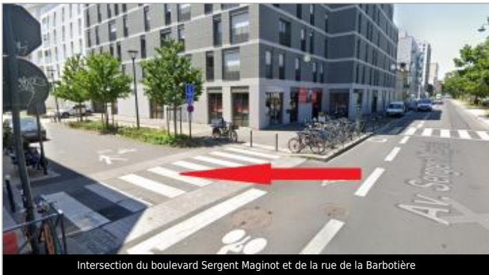
Intersection du boulevard Sergent Maginot et de la rue de la Barbotière

GÉOLOCALISATION Coordonnées WGS84 : X: -1.66677368 / Y: 48.10984160 Coordonnées RGF93 (Lambert 93) : X: 352877.5 / Y: 6789090.61 Coordonnées RGF93 (ETRS89) : X: -1.6667737 / Y: 48.1098416 Code Hydro: J---0060 Rive de référence: Droite