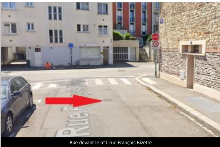
Rue devant le n°1 rue François Bizette

GÉOLOCALISATION Coordonnées WGS84 : X: -1.66771850 / Y: 48.11075490 Coordonnées RGF93 (Lambert 93) X: 352813.31 / Y: 6789196.08 Coordonnées RGF93 (ETRS89) : X: -1.6677185 / Y: 48.1107549 Code Hydro: J---0060 Rive de référence: Droite