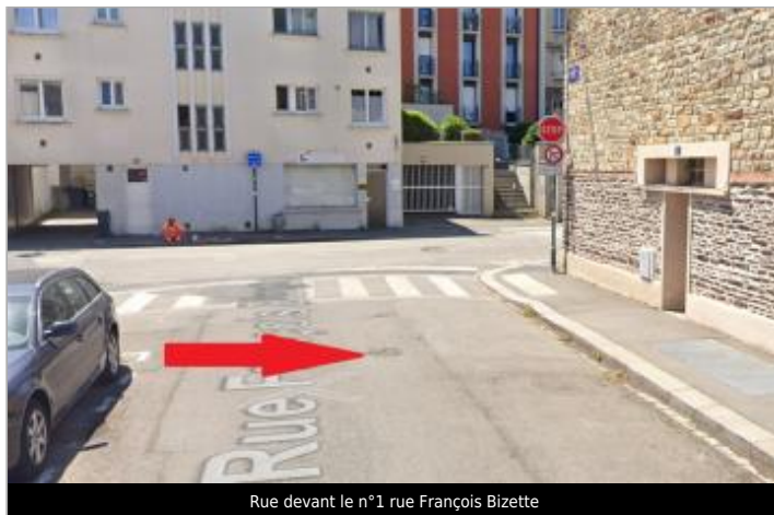
Rue devant le n°1 rue François Bizette

Coordonnées WGS84 : X: -1.66771850 / Y: 48.11075490