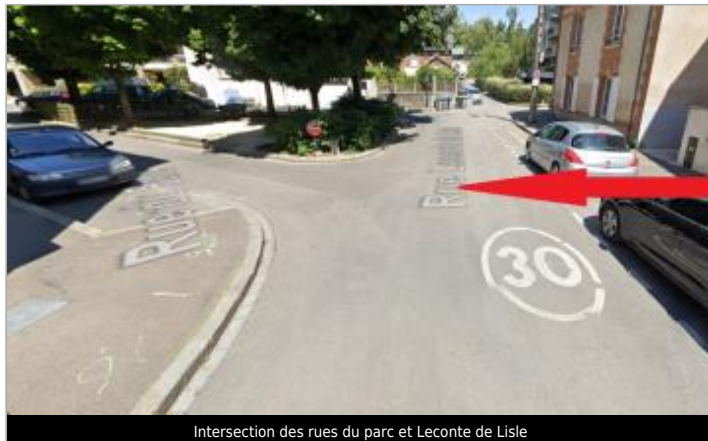
Intersection des rues du parc et Leconte de Lisle

Coordonnées WGS84 : X: -1.66957290 / Y: 48.11084230