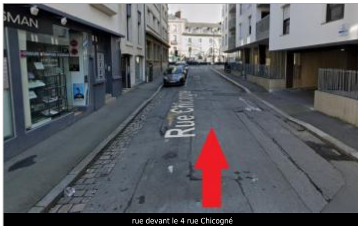
rue devant le 4 rue Chicogné

Coordonnées WGS84 : X: -1.68324904 / Y: 48.10789640