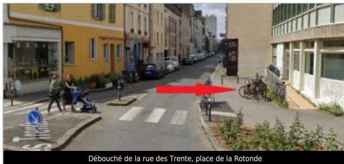
Débouché de la rue des Trente, place de la Rotonde