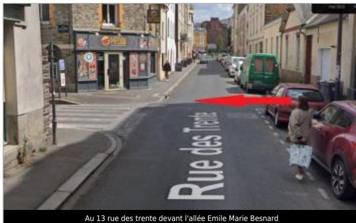
Au 13 rue des trente devant l'allée Emile Marie Besnard