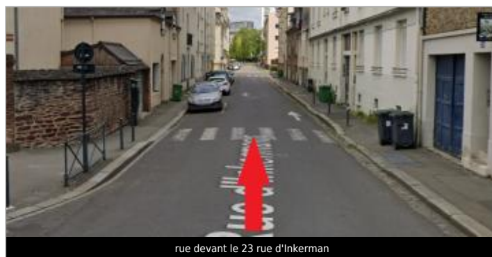
rue devant le 23 rue d'Inkerman