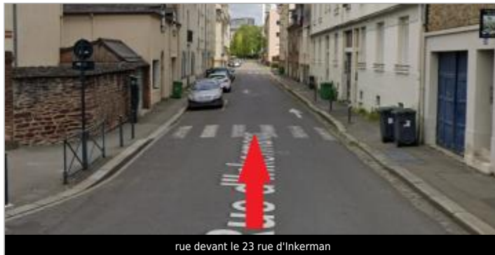
rue devant le 23 rue d'Inkerman