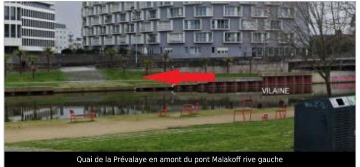
Quai de la Prévalaye en amont du pont Malakoff rive gauche

Coordonnées WGS84 : X: -1.69250731 / Y: 48.10731330