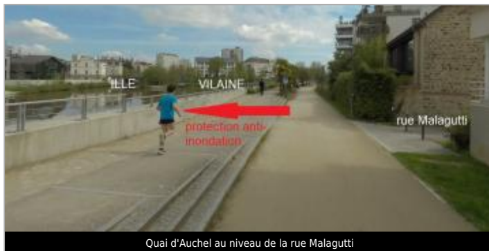
Quai d'Auchel au niveau de la rue Malagutti