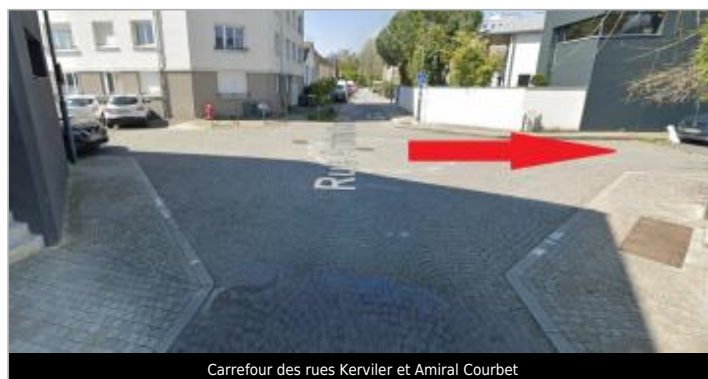
Carrefour des rues Kerviler et Amiral Courbet

GÉOLOCALISATION Coordonnées WGS84 : X: -1.70562390 / Y: 48.10755750 Coordonnées RGF93 (Lambert 93) : X: 349976.05 / Y: 6789008.73 Coordonnées RGF93 (ETRS89) : X: -1.7056239 / Y: 48.1075575 Code Hydro: J---0060 Rive de référence: Droite