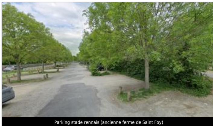
Parking stade Rennais (ancienne ferme de Saint Foy)