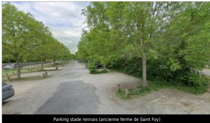
Parking stade rennais (ancienne ferme de Saint Foy)

Coordonnées WGS84 : X: -1.71821171 / Y: 48.10294190