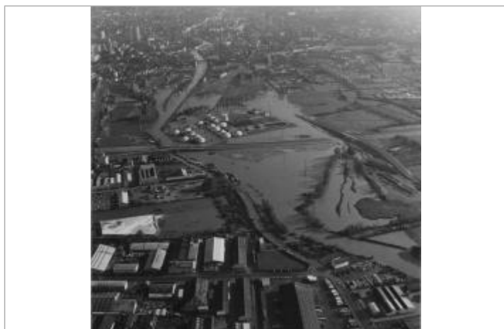
Photographie aérienne de l'inondation de novembre 1974