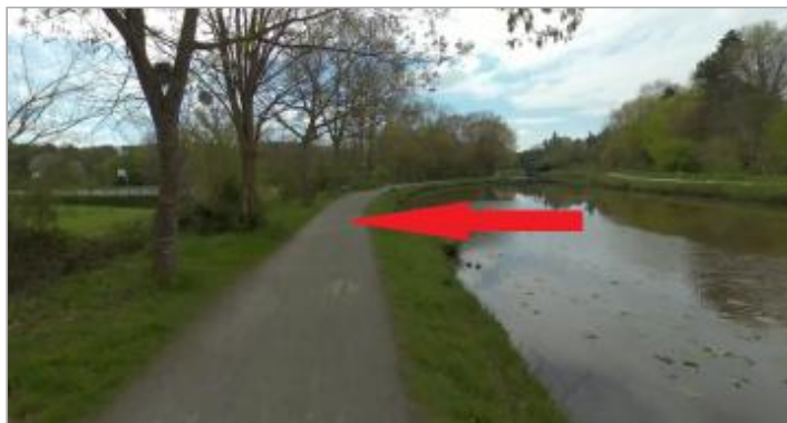
Chemin de halage rive gauche au niveau du stade de la Bellangerais