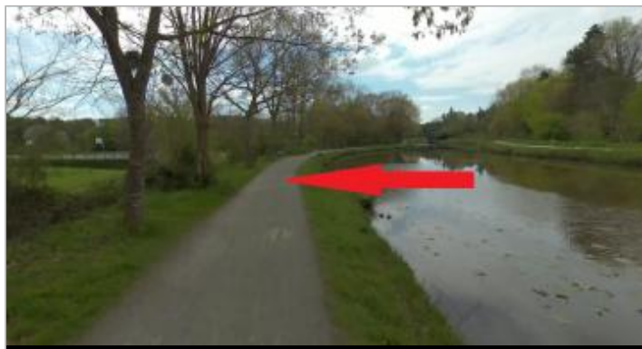
Chemin de halage rive gauche au niveau du stade de la Bellangerais

Coordonnées WGS84 : X: -1.68003921 / Y: 48.13146670