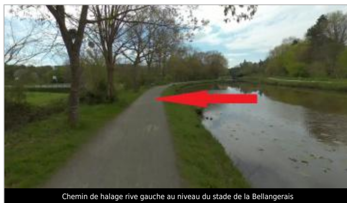
Chemin de halage rive gauche au niveau du stade de la Bellangerais

GÉOLOCALISATION Coordonnées WGS84 : X: -1.68003921 / Y: 48.13146670 Coordonnées RGF93 (Lambert 93) X: 352034.3 / Y: 6791548.01 Coordonnées RGF93 (ETRS89) : X: -1.6800392 / Y: 48.1314667 Code Hydro: J71-0300 Rive de référence: Gauche