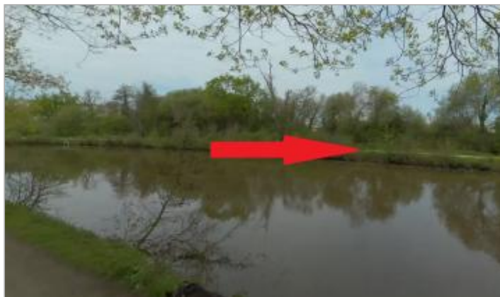
Chemin de halage rive droite