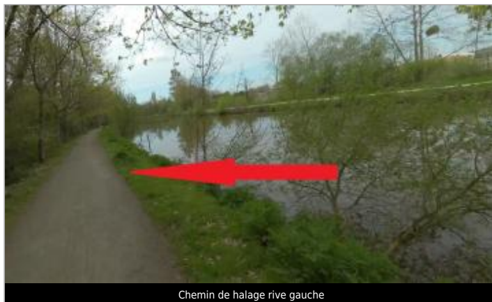
Chemin de halage rive gauche