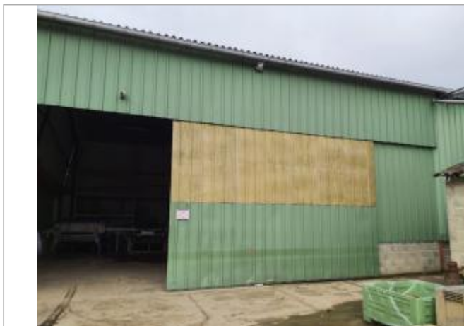
Marque sur structure

Coordonnées WGS84 : X: 1.07978960 / Y: 44.01867270