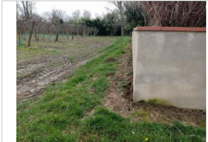
Marque surstructure

Coordonnées WGS84 : X: 1.11418450 / Y: 44.01063630