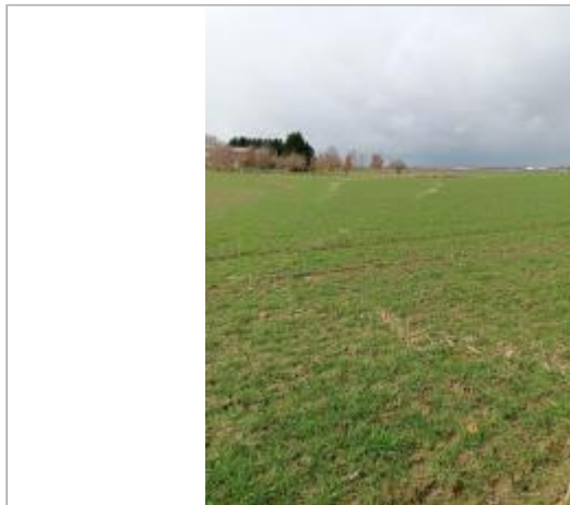
Débris végétaux

Coordonnées WGS84 : X: 1.12814120 / Y: 44.00594050