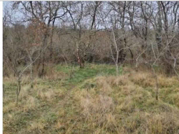
Marque sur végétaux

Coordonnées WGS84 : X: 1.15505340 / Y: 43.98579620