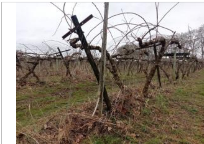
Marque sur poteau

Coordonnées WGS84 : X: 1.17289820 / Y: 43.95075990