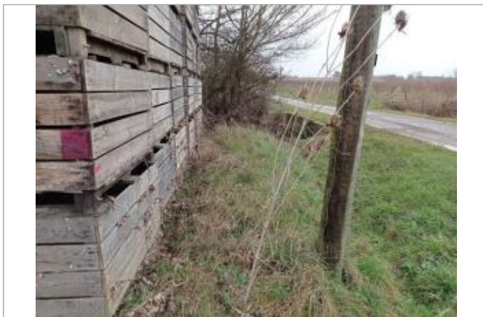
Marque sur pallox