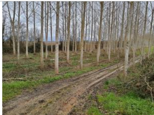
Marque sur végétaux

Coordonnées WGS84 : X: 1.18167400 / Y: 43.92889830