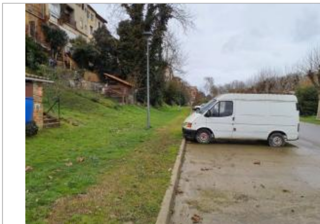
Marque sur véhicule