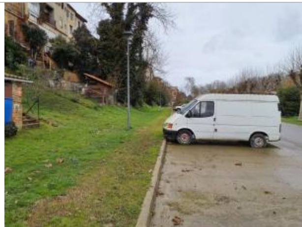
Marque sur véhicule