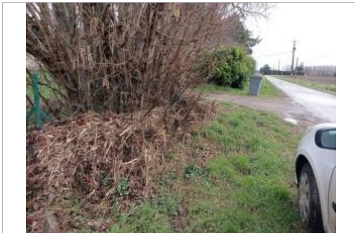
Marque sur cloture