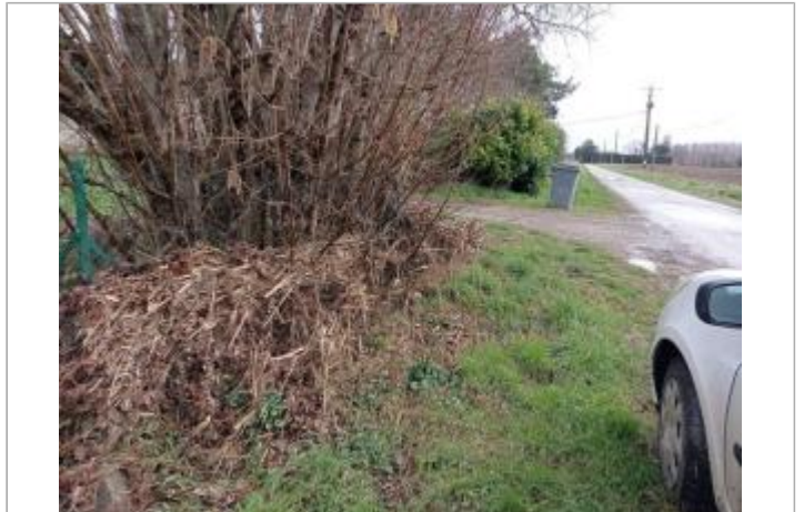
Marque sur clôture

Coordonnées WGS84 : X: 1.25391060 / Y: 43.84929990