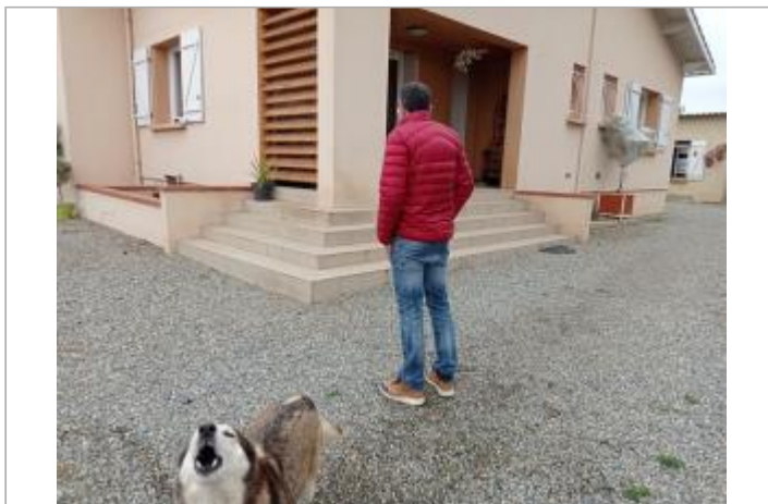
Marque sur structure (témoignage)