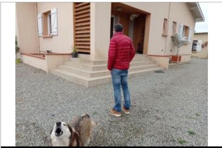
Marque sur structure (témoignage)

GÉOLOCALISATION Coordonnées WGS84 : X: 1.28517080 / Y: 43.81145730 Coordonnées RGF93 (Lambert 93) X: 562015.94 / Y: 6302880.93 Coordonnées RGF93 (ETRS89) : X: 1.2851708 / Y: 43.8114573 Code Hydro: O--0000 Rive de référence: Droite