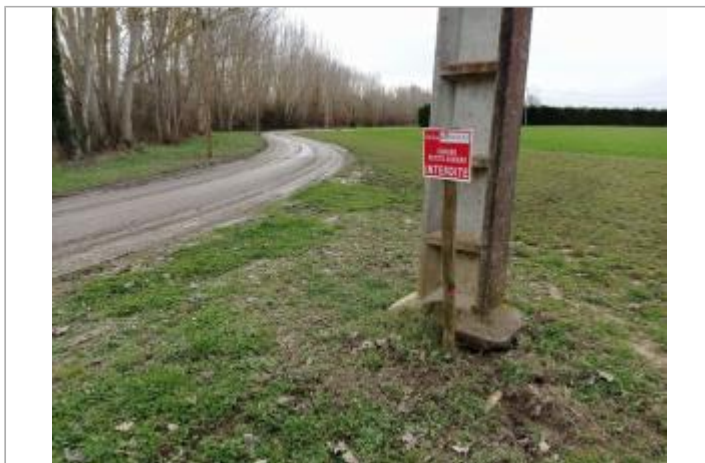
Marque sur poteau