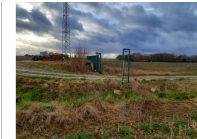
Marque sur rocher

Coordonnées WGS84 : X: 1.27671470 / Y: 43.78853150