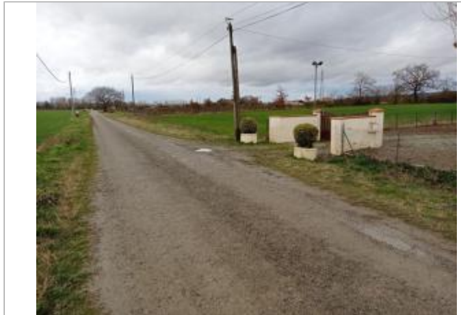
Marque sur structure

Coordonnées WGS84 : X: 1.29277850 / Y: 43.78939500