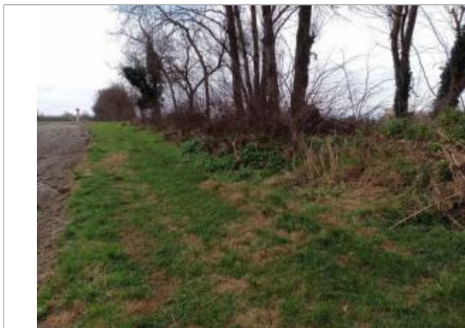
Débris végétaux

Coordonnées WGS84 : X: 1.31858460 / Y: 43.77579290