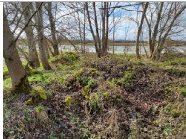
Marque sur Végétation

Coordonnées WGS84 : X: 1.31761380 / Y: 43.77011660