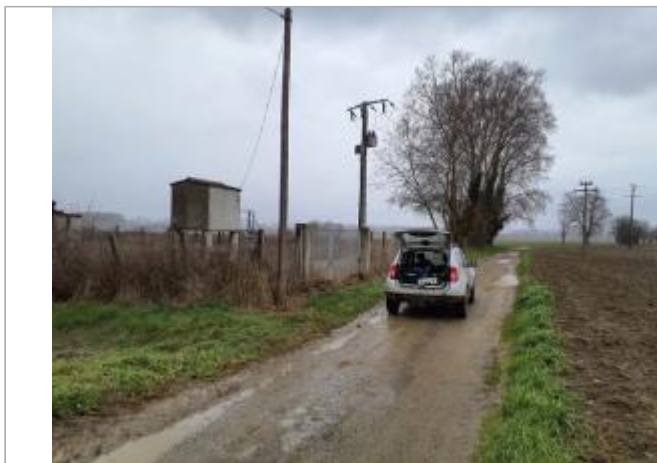
Débris végétaux

Coordonnées WGS84 : X: 1.30466820 / Y: 43.76658740