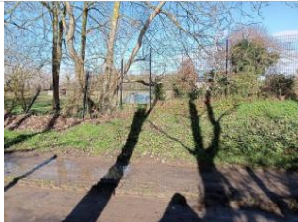
Marque sur grillage