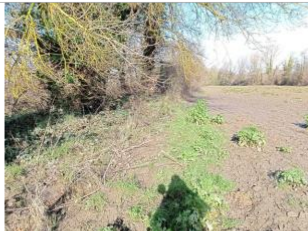
Marque sur végétaux