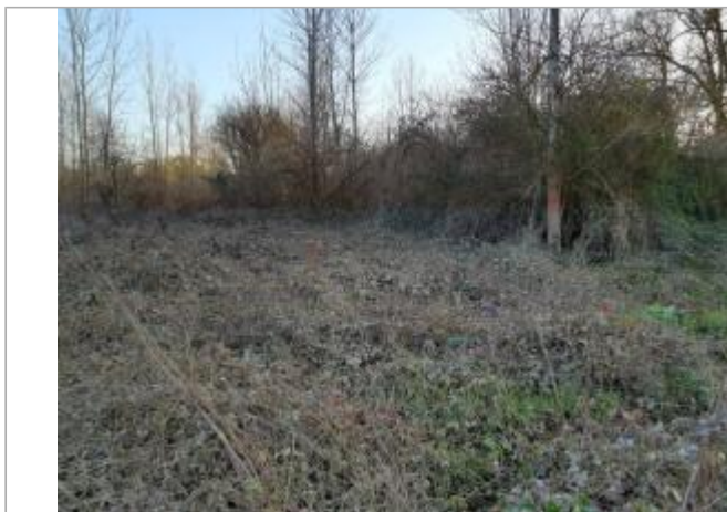
Marque sur végétaux

Coordonnées WGS84 : X: 1.33339030 / Y: 43.72568450