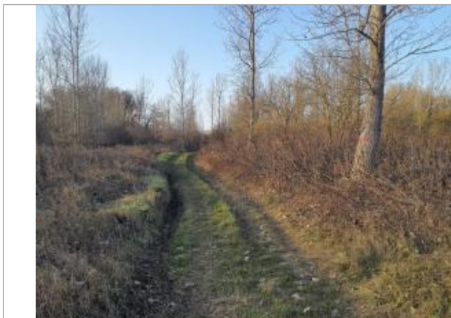
Marque sur végétaux

Coordonnées WGS84 : X: 1.33519170 / Y: 43.72399570