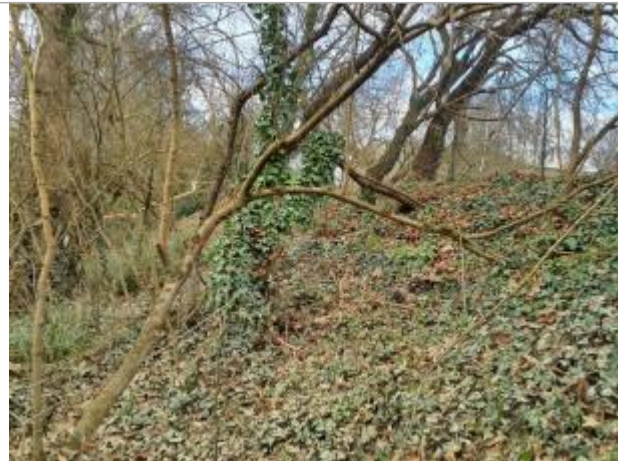
marque sur Végétation

Coordonnées WGS84 : X: 1.34592310 / Y: 43.72165220