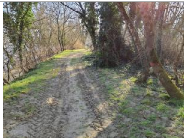
Marque sur Végétation

Coordonnées WGS84 : X: 1.35259910 / Y: 43.70752430