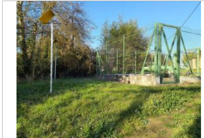
Marque sur structure

Coordonnées WGS84 : X: 1.37121010 / Y: 43.69743460