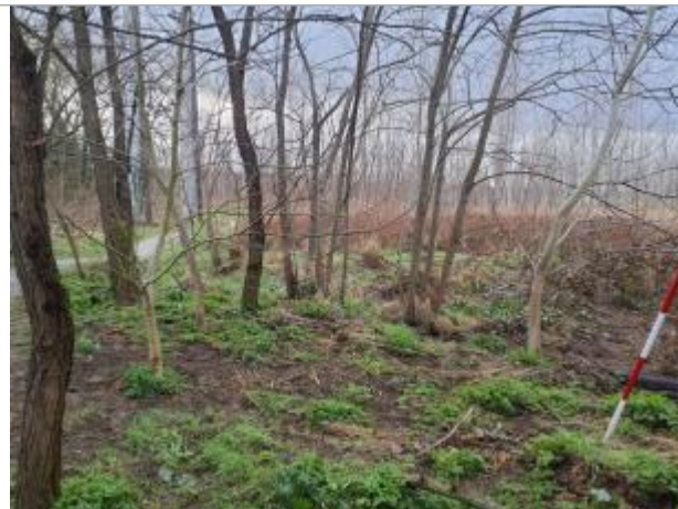
Marque sur Végétation

Coordonnées WGS84 : X: 1.36683970 / Y: 43.69417360