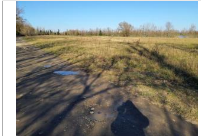
Débris végétaux

Coordonnées WGS84 : X: 1.36934140 / Y: 43.68559110