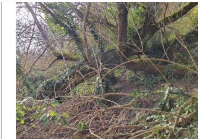
Marque sur végétaux

Coordonnées WGS84 : X: 1.37014960 / Y: 43.68018100