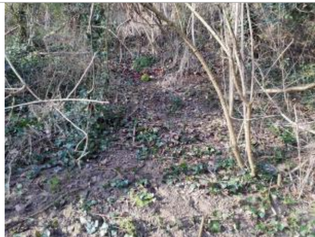
Marque sur végétaux

Coordonnées WGS84 : X: 1.37080650 / Y: 43.67888930